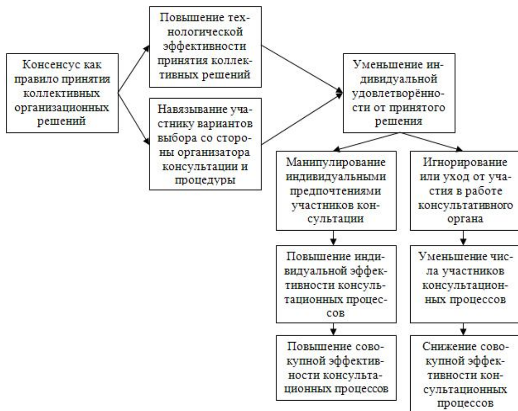
Рисунок 3. Схема-интерпретация «парадокса ограниченного выбора»

Исторически с 1950-х гг. эффективность определялась как одно из ключевых свойств международной консультации и со временем превратилась в фактор, оказывающий регулируемое влияние на ход консультационного процесса. Обнаружена прямая зависимость технологической эффективности консультаций, измеряемой в настоящем исследовании индексом технологической эффективности, от степени манипулирования правилами принятия организационных решений. Консенсус наряду с правилом диктатуры и правилом Нэнсона относится к наименее манипулируемым правилам по шкале Нитцана-Келли, что не даёт возможности участникам консультации изменять консультационные нормы и процедуры для реализации своих частных интересов (осознанных потребностей).