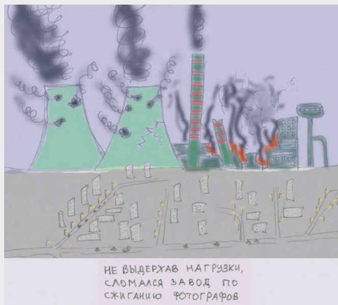
Рис. 1. Автор картинка – пользователь «Живого Журнала» Аингер.

ный охваченный пожаром завод в клубах густого дыма. Под картинкой было написано: «не выдержав нагрузки, сломался завод по сжиганию фотографов» (рис. 1). Картинка иллюстрировала ситуацию насыщения информационного пространства интернета идентичными фотографиями, создаваемыми растущим числом фотографов-любителей.