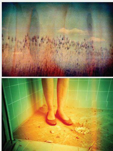
Рис. 2, 3. Примеры фотографий, выполненных в

номерная плотность кадра, соблюдение законов перспективы), во многом заимствованной из живописи 11 . Теснимая, с одной стороны, техничностью и всеохватностью цифровой революции и альтернативным эстетизмом ломографического движения – с другой, пленочная фотография перестает существовать в той форме, в которой она существовала до этого. Иными словами, она утрачивает востребованность как среди профессионалов, отдающих предпочтение совершенству цифрового изображения и удобству использования новой техники, так и среди любителей, которые покупают себе цифровые «мыльницы» или полупрофессиональные зеркальные камеры. Ломография в таких условиях превращается в симулякр классической аналоговой фотографии. Непрерывающееся производство пленки, а также оживление на рынке антикварных и просто устаревших камер вызваны не интересом к старой эстетике фотообраза 12 , а популярностью ломографического и подобных движений и модой на винтаж. Эти и другие факторы позволяют констатировать смерть пленочной фотографии в том смысле, что она больше не создает стоимости: не производятся современные аналоговые фотоаппараты, объемы продаж пленки с каждым годом уменьшаются 13 .