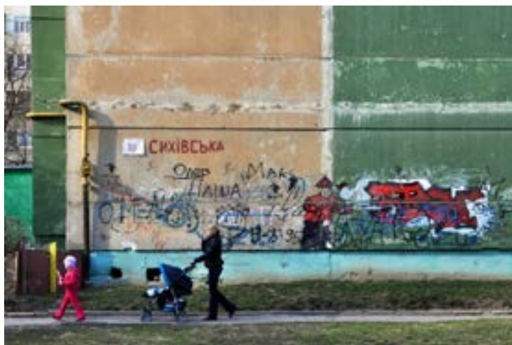
Рис. 7. Внутренний двор

Первыми жителями Сыхова были преимущественно молодые семьи, и, как вспоминает Степан , ребенком переехавший в Сыхов, отличительной чертой района было то, что «там всегда было много детей на улицах». Большинство опрошенных сказали, что их район очень комфортный для семей с детьми. Ярина переехала в Сыхов, когда ей исполнилось двадцать, но поняла, что это «идеальное место» только спустя несколько лет, когда стала мамой. Район стал удобным для нее «не только потому, что торговый центр и большой рынок рядом, но и потому, что детские и спортивные площадки... и, конечно, лес возле дома». Она, как и большинство респондентов, заметила, что проводила большое количество свободного времени в лесопарке, а для некоторых он до сих пор является любимым местом в районе. Но также Ярина сказала, что ей нужно было сделать выбор между организацией досуга детей и возвращением к работе, поскольку ей пришлось бы тратить слишком много времени на дорогу. «Район с большим количеством молодых мам» — подобные формулировки были использованы несколькими респондентами. Иван также отметил, что отличительной чертой Припяти, где по-другому были организованы функциональное зонирование и инфраструктура, было то, что в семьях с детьми там обычно работали оба родителя.