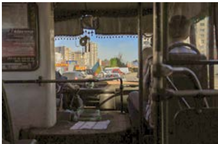
Рис. 3. Транспортный узел «Санта Барбара». Вид из микроавтобуса.

стический/сельский могут быть более эффективными такие его характеристики, как соединенность или отсоединенность с/от городом/-а, аналогично идее Ю. Кинг, которая предложила заменить концепты urban/rural на connected/disconnected для некоторых новых типов урбанности.