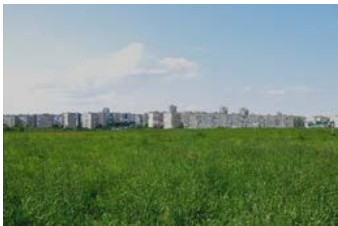
Рис. 1. Вид на район Сыхов с кольцевой дороги

Улица Криворизька проходила вдоль главной оси, начерченной еще в первом эскизе самого большого социалистического района Львова. Эта улица должна была соединить новый жилой район с кольцевой дорогой, но вместо этого она остановилась среди поля, постепенно обрастая стихийной инфраструктурой. Район Сыхов, который должен был стать «южными воротами» в город, остался бетонной стеной, которую можно увидеть, проезжая по кольцевой. Когда-то улица Криворизька , а сегодня — проспект Червоной Калыны , как и было запланировано, выполняет функцию главной транспортной артерии района, но сам Сыхов, который должен был стать одним из важных узлов в структуре полицентричного города, долгое время воспринимался лишь как его периферия, а иногда и вовсе как территория, граничащая с городом. Львов часто называют архитектурным палимпсестом, где на историческое ядро концентрически наслаивается архитектура, отображающая драматические повороты истории города, но при этом неотрефлексированная архитектура модернизма часто остается вне дискурса о материальном наследии.