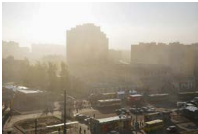
Рис. 4. «Санта Барбара», транспортный узел и торговый центр

Уровень района. Описывая район, респонденты не использовали названия улиц, за исключением названий двух главных — Сыховской и проспекта Червоной Калыны, которые формируют основу структуры района и имеют некоторые черты, соответствующие функционированию исторического типа улицы. Для ориентации в пространстве жители района используют пространственные элементы — точечные или плоскостные. Четыре основных общественных кластера района — это главный обществен-