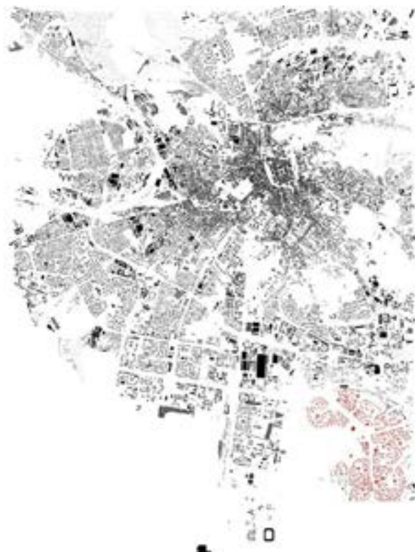
Рис. 2. Район Сыхов в структуре Львова

Однако в Сыхове в большинстве случаев строительство общественных зданий и комплексов происходило медленнее, чем строительство жилья, а некоторые из них и вовсе не были построены [3]. Кроме того, начальный проект района не был осуществлен в полной мере из-за экономического кризиса, начавшегося вскоре после выхода вышеупомянутой публикации. Поскольку комплексность была достигнута только частично, жители Сыхова унаследовали район как физическую структуру, лишенную некоторых функциональных связей в новом контексте. Впоследствии начало формироваться качественно новое жилое пространство и вырабатываться пат-