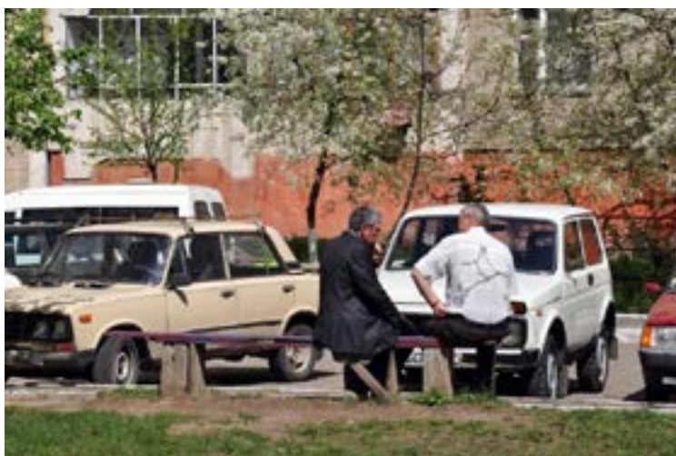
Рис. 6. Внутренний двор