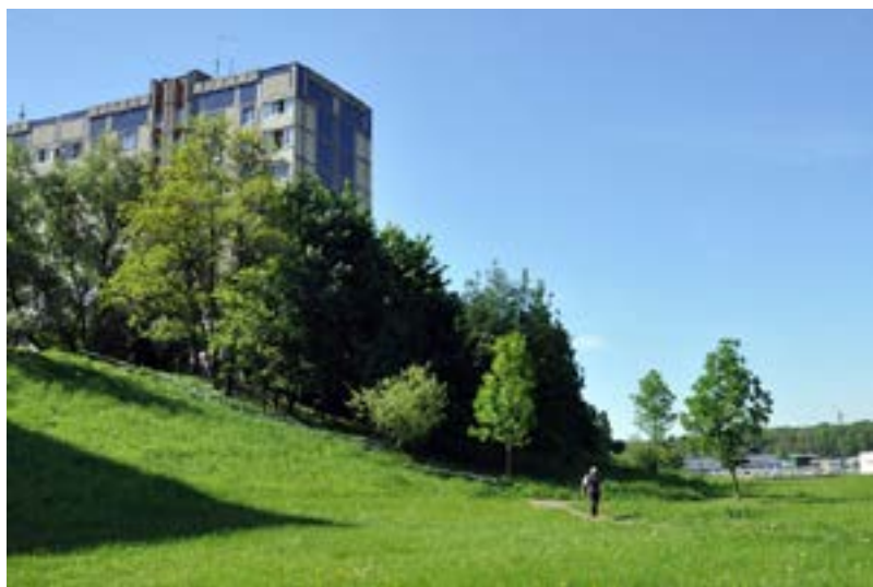
Рис. 5. Транзитное пространство проспекта Червоной Калыны

ный центр с церковью, кинотеатром, а также обеспечивающий торговую, спортивную и некоторые другие функции, а также — три субцентра обозначены торгово-бытовыми центрами — «Искра», «Шувар» и «Санта Барбара». Последнее название фиксирует гибридный характер 1990-х. Тогда в противовес официальному названию торгово-бытового центра «Зубра» (Зубра — близлежащие село и река) активно использовалось народное название «Санта Барбара», происходящее от названия одноименного телесериала, популярного среди зрителей украинского телевидения в середине 1990-х. Во вступительной заставке сериала были использованы мотивы арок, которые также стали отличительным элементом сооружения упомянутого торгово-бытового центра, получившего первую премию на ежегодном смотре-конкурсе проектов в области архитектуры и градостроительства Украины. Практически сразу народное название прижилось и стало фигурировать в расписаниях транспорта; сегодня топоним «Санта Барбара» обозначает территорию нескольких прилегающих микрорайонов.