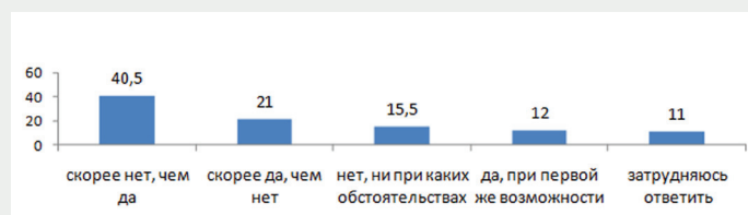
Рис.2. Желание уехать из села, в %, (n=200)

Миграционные установки селян мы исследовали, предложив респондентам ответить на вопрос — «Хотели бы Вы уехать из своего села?». Как показывает рисунок 2, суммарный процент тех, кто скорее готов уехать, чем нет, и тех, кто готов покинуть село при первой же возможности составляет 33% — треть всех опрошенных. Однако, более половины — 56% опрошенных жителей с. Парфеньево не хотят уезжать из села.