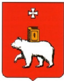
Герб города Перми