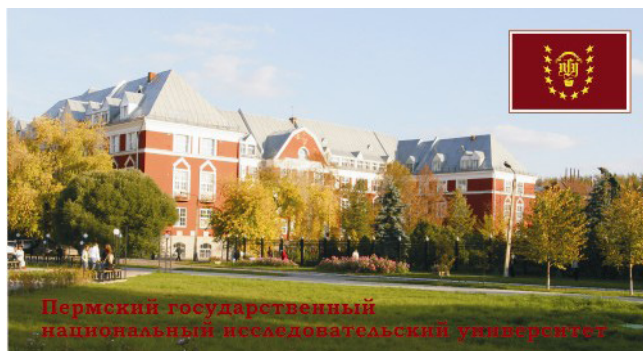
Сувенирный магнит ПГНИУ с изображением корпуса №2 (исторического)

ПГНИУ обладает таким конкурентным для брендирования преимуществом, как университетский кампус — обособленную, защищенную территорию, являющуюся при этом частью городского пространства. Он активно продвигает свой университетский городок как кампус, локализованный в одном месте и создающий особую университетскую атмосферу: «На пересечении двух улиц разместились центральный сквер с фонтаном, башня с часами, площадь, ботанический сад, музеи, учебные аудитории, библиотеки и дворец культуры» [18]. Этот вид территория университета приобрела после 2006 года, когда благодаря усилиям влиятельных выпускников был достроен семиэтажный корпус и разбит центральный сквер. Но разностилевые здания городка не объединены четкой визуальной концепцией. Вероятно, поэтому существуют разные уровни визуальных образов университета. Прежде всего, эксплуатируются изображения двух самых старых корпусов университета — столетнего исторического корпуса, подаренного университету Н. В. Мешковым, и «корпуса с колоннами» (бывшее здание кожевенного завода Алафузова, купленного Мешковым для университета). Они дополняются целым набором «малых» образов, включающих научные лаборатории и их сотрудников, новое оборудование — все то, что в первую очередь делало наглядным результаты больших финансовых вливаний после получения университетом в 2010 г. статуса национального исследовательского.