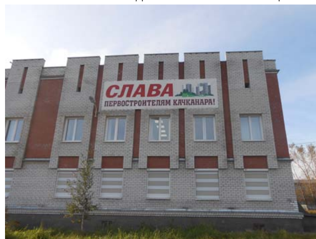
Рис. 2. «Слава первостроителям Качканара!» — лозунг на городской площади в 2013 г., в год 50-летия пуска комбината (материалы исследовательского фотомэппинга).

В контексте столь суровых проблем создания, по Когану, постоянного населения, развитый в Качканаре культ первостроителей предстает уже не только долгом памяти в рамках мифа основания, но и способом символически «закрепить» в данном месте людей (См. рис. 2).